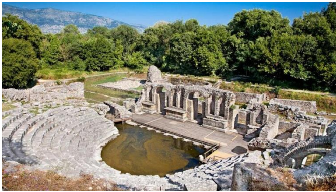
Weltkulturerbe Ruinenstätte Butrint.

Programmänderungen bleiben ausdrücklich vorbehalten.